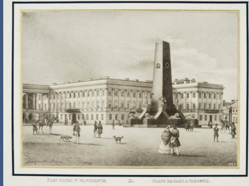
PLAC SASKI W WARSZAWIE. II. PLAC DE SAXE A VARSOVIE.

100 1 Scholtz, Maurycy| (fl. ca 1840-1850).