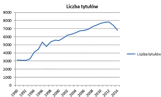
Wykres 2. Liczba tytułów periodyków publikowanych w Polsce w latach 1990–2014

Tendencja do spadku liczby tytułów gazet i czasopism pojawiła się w ostatnich latach nie tylko w Polsce. Podobnie dzieje się obecnie na przykład właśnie we Francji, gdzie liczba odnotowywanych przez Bibliotekę nationale de France tytułów periodyków w ciągu ostatnich dwóch lat także zmniejszyła się o ok. 1000 tytułów (choć tam zmiana ta przekłada się zaledwie na ok. 2,5% wszystkich periodyków) 29 . Dane niemieckie z kolei wskazują na zmniejszanie się liczby dzienników 30 . Zmiany te można wpisać w szerszy proces – charakterystyczne dla krajów wysokorozwiniętych (zwłaszcza europejskich i północnoamerykańskich) kurczenie się rynku prasy papierowej 31 , przypisywane przede wszystkim przejmowaniu jej klientów przez media elektroniczne.