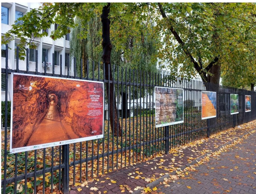
Państwowy Instytut Geologiczny