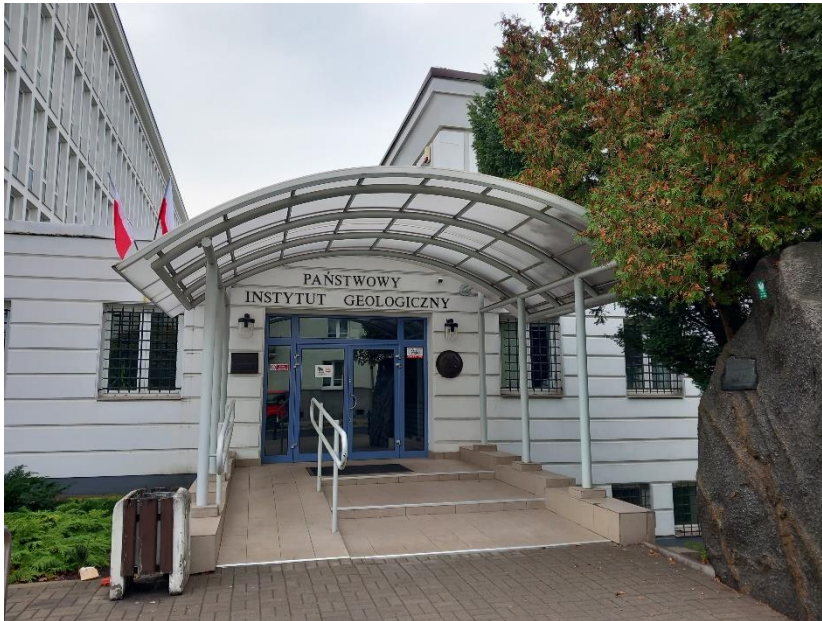
Państwowy Instytut Geologiczny

Dział 55 Geologia został przetłumaczony we współpracy z pracowniczkami Biblioteki Państwowego Instytutu Geologicznego .