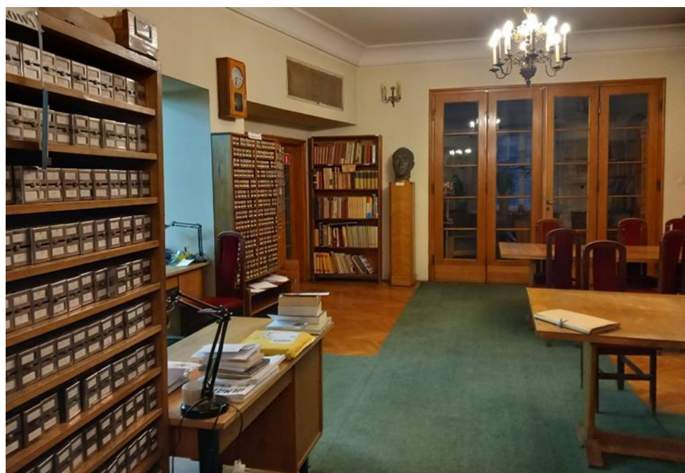
Biblioteka Donacji Pisarzy Polskich