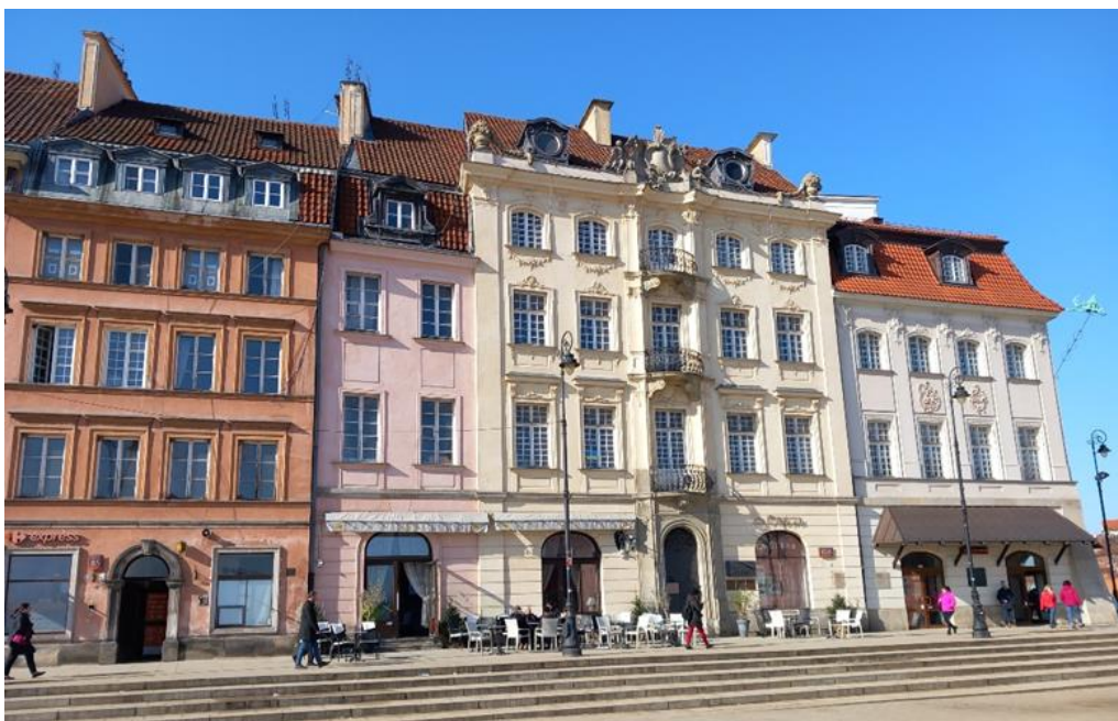
Biblioteka Donacji Pisarzy Polskich